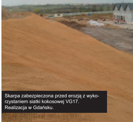
Skarpa zabezpieczona przed erozją z wykorzystaniem siatki kokosowej VG17. Realizacja w Gdańsku.