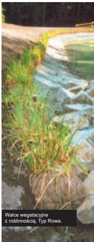
Walce vegetacyjne z roślinnością. Typ Rowa.