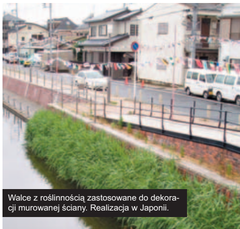
Walce z roślinnością zastosowane do dekoracji murowanej ściany. Realizacja w Japonii.

Walce vegetacyjne są to bioinżynieryjne elementy stosowane w różnych technikach stabilizacji linii brzegowych wzdłuż jezior, rzek i zalewów. Wykonane są z naturalnych włókien kokosowych, które ściśle wypełniają siatkę konstrukcyjną wykonaną z neutralnego dla środowiska polipropylenu odpornego na promieniowanie UV, przemarzanie i związki chemiczne. W podstawowym wariantcie przeznaczone są do obsadzenia roślinnością po zainstalowaniu. W przypadku gdy niezbędne jest szybkie uzyskanie efektu zazielenienia walce mogą być instalowane z wcześniej już zasadzoną i zakorzenioną roślinnością. Doboru roślinności dokonuje się z uwzględnieniem funkcji które ma pełnić (oczyszczanie wody, redukcja występowania sinic, dekoracja) oraz z uwzględnieniem roślinności naturalnie występującej na danym obszarze.