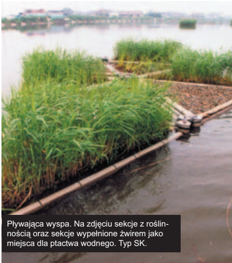
Pływająca wyspa. Na zdjęciu sekcje z roślinnością oraz sekcje wypełnione żwirem jako miejsca dla ptactwa wodnego. Typ SK.

Są to pływające elementy (nośniki) roślinności stosowane w kształtowaniu krajobrazu, ochronie środowiska, oczyszczaniu wody, kompensacji falowania, utrzymaniu szlaków wodnych, inżynierii wodnej. Składają się z elementów nośnych zapewniających konstrukcji stabilność i odpowiednią wyporność na których nasadza się odpowiednie gatunki roślinności. Pływające wyspy często są stosowane jako miejsca lęgowe dla ptactwa wodnego. Konstrukcje te są odporne na typowe uwarunkowania środowiska wodnego, a więc na lód, falowanie czy też uszkodzenia mechaniczne