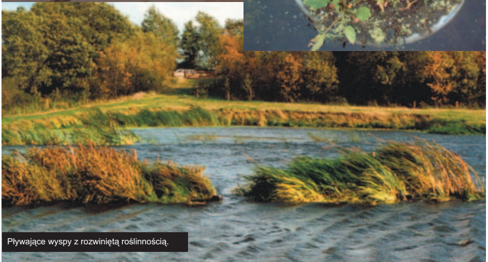
Pływające wyspy z rozwiniętą roślinnością.