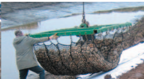
Układanie materacy kamiennych KDW. Realizacja na rzece Elbie w okolicy Hamburga.