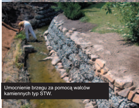
Umocnienie brzegu za pomocą walców kamiennych typ STW.