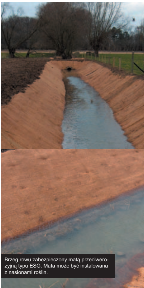
Brzeg rowu zabezpieczony matą przeciwoerozyjną typu ESG. Mata może być instalowana z nasionami roślin.

Przy ich użyciu problem erozji oraz zachwianej roślinności na terenach podmokłych brzegów rzek i strumieni może być łatwo rozwiązany. Szybki wzrost roślin oraz ich systemów korzeniowych umożliwia kontrolę erozji powodowaną falowaniem oraz prądami, a także zapewnia atrakcyjny wygląd umocnianego terenu w krótkim czasie po zainstalowaniu maty. W zależności od rodzaju, maty przeciwoerozyjne zbudowane są ze słomy i włókien kokosowych w różnych proporcjach oraz siatki polipropylenowej. Produkowane są w wersji z nasionami roślin lub bez nasion.