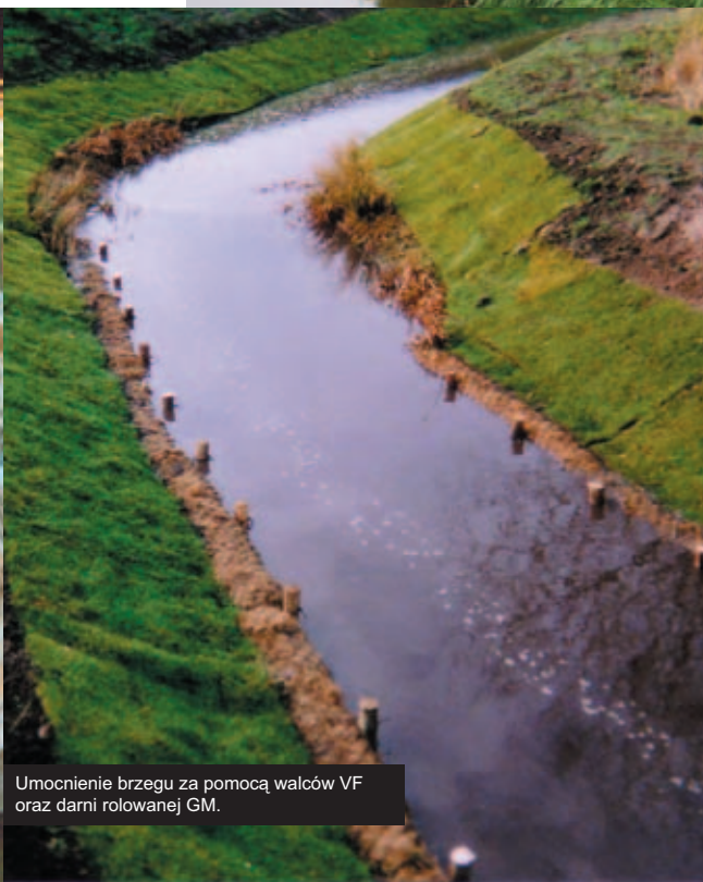
Umocnienie brzegu za pomocą walców VF oraz darni rolowanej GM.