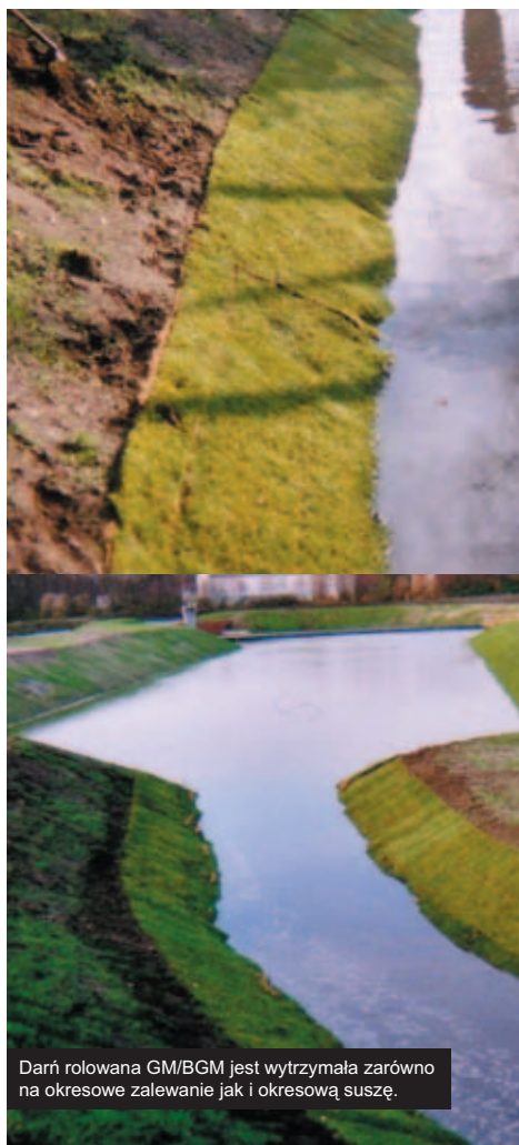
Darń rolowana GM/BGM jest wytrzymała zarówno na okresowe zalewanie jak i okresową suszę.

Rolowane maty ze specjalnymi trawami stosowanymi na terenach suchych i zalewanych krótkookresowo, wysiewanymi na odpowiednim podłożu, które zazwyczaj stanowi wysokowytrzymała siatka kokosowa lub geosyntetyk (w zależności od zastosowania). Specjalnie wyselekcjonowany gatunek trawy dobrze znosi warunki ekstremalne – zarówno krótki okres suszy, jak i krótki okres pod wodą.