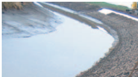
Umocnienie brzegu za pomocą materacy kamiennych KDW. Realizacja na rzece Elbie w okolicy Hamburga.

Materace i walce kamienne są strukturami przestrzennymi. Wykonane są z mocnej polipropylenowej siatki wypełnionej materiałem kamiennym. Najczęściej stosuje się je na granicy łądu i wody gdzie występuje szczególne zagrożenie erozji brzegu. Ich główną zaletą jest elastyczność, dzięki czemu doskonale dopasowują się do podłoża stanowiąc jego ochronę. W stosunku do zwykłego narzutu kamiennego drastycznie zredukowana jest ilość używanego kamienia (nawet o 60%), co przekłada się na znaczne obniżenie kosztu inwestycji. Walce kamienne najczęściej stosuje się w miejscach występowania silnych prądów, gdzie wymagana jest ochrona stromych brzegów przed erozją oraz odbudowa roślinności. Doskonale sprawdzają się w trudnych warunkach dla rozwoju roślin, takich jak wody o lekkim zasoleniu, zasadowe bądź kwaśne przy wysokich brzegach, gdzie nie ma wystarczająco dużo przestrzeni dla normalnego rozwoju roślinności. Materace i walce kamienne mogą być stosowane również w wersji wegetacyjnej (obsadzone roślinnością wodną)