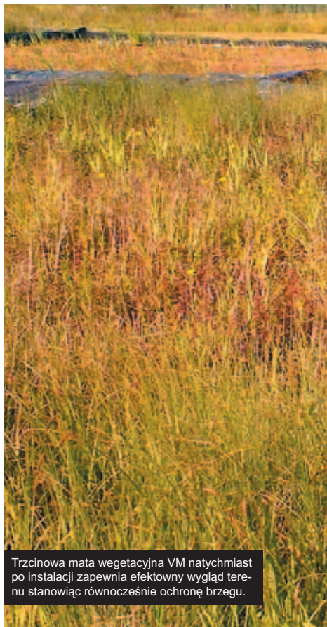
Trzcinowa mata vegetacyjna VM natychmiast po instalacji zapewnia efektowny wygląd terenu stanowiąc równocześnie ochronę brzegu.

Trzcinową matę vegetacyjną stosuje się do stabilizacji brzegów rzek, jezior czy stawów. Wykonuje się ją z biodegradowalnego geosyntetyku porośniętego roślinnością wodną. Na teren budowy dostarczana jest z silnie rozwiniętą roślinnością dzięki czemu natychmiast po zainstalowaniu spełnia zarówno rolę ochronną dla brzegu jak też dekoracyjną. Uzyskiwany jest szybki efekt polegający na przykryciu obszaru rozwiniętą roślinnością. Specjalna konstrukcja mat zapobiega ich zniszczeniu przez żerującą zwierzynę. W zależności od lokalnych warunków maty mogą być przygotowane z odpowiednio dobraną roślinnością, która dobrze wkomponuje się w naturalne otoczenie.